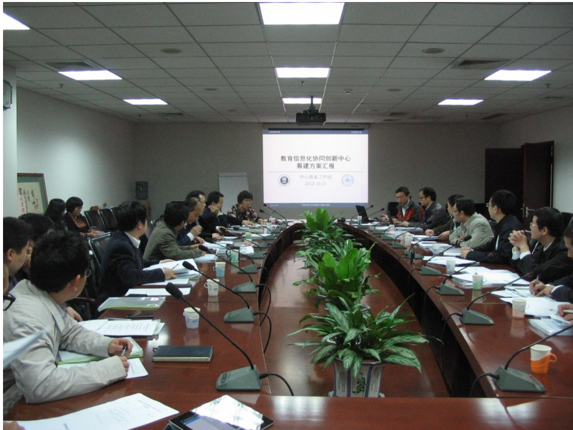
图 1 两校联合办公会会场

会议旨在推动教育信息技术协同创新中心建设,明确中心体制机制、研究方向等内容。会议听取协同创新中心筹备工作组汇报阶段性工作,深入研讨了两校在教育信息化开展深层次合作的具体研究方向和可能形成的社会影响,集中讨论了教育信息技术协同创新中心可能面临的问题。本次会议集中了两校领导在“2011协同创新”计划中的最新思考成果,并就未来筹备工作组的工作任务给出了明确指示。